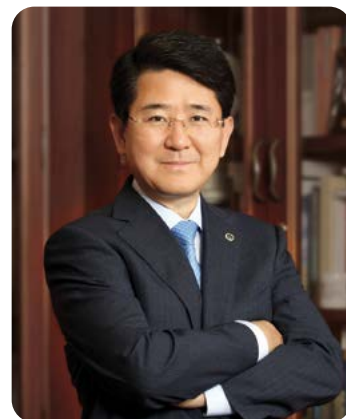
제주한라대학교 총장 | 경영학박사

대학이라는 새로운 환경에서 꿈을 펼쳐나갈 학생 여러분! 제주한라대학교에서 보다 넓고 큰 세계를 향해 도전할 수 있는 자신감과 에너지를 갖기 바랍니다. 저희는 여러분의 빛나는 미래를 위해 언제나 노력할 것입니다.